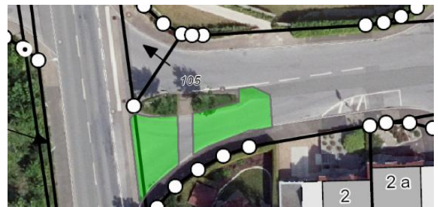
Stadt Halle (Westf.)