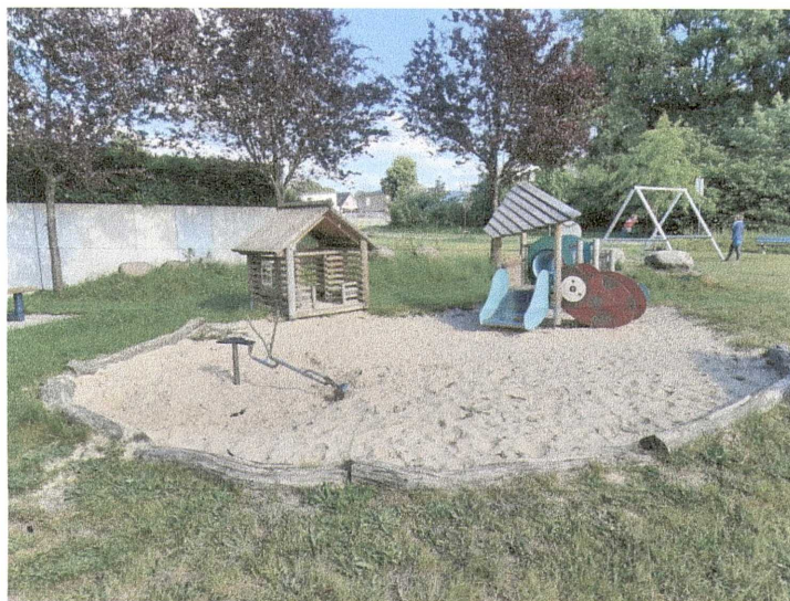
Abbildung des Spielplatzes „Bachweide“: Der Sandbereich ist vor direkter Sonneneinstrahlung kaum geschützt.